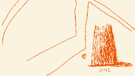
東京インプログレス 2012 『豊洲ドーム』